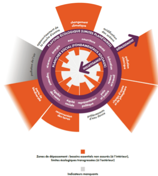
Figure 1 Adaptation française du schéma de Kate Raworth 1